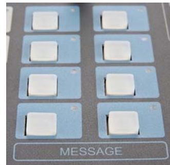
8 Anuncios, Sonidos o Contenido Audible Pregrabados por el Usuario (.mp3 or WMA)