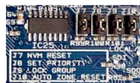
Jumper J6 – Altavoz Interno (on/off) Jumper J7 – Memoria No Volátil (resetear) Jumper J8 – Establecer Prioridad de Micro (Sólo en DCM1) Jumper J9 – Bloqueo de Grupo (on/off) Jumper J10 – Reset Automático de Zona (on/off)