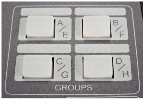
8 Grupos de Anuncios y/o 8 Grupos de Mensajes Zonales