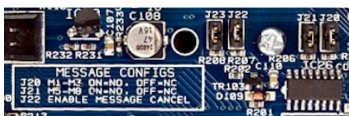
Jumper J20 – Disparo de Mensaje 1-2 (NO/NC) Jumper J21 – Disparo de Mensaje 3-4 (NO/NC) Jumper J22 – Disparo de Mensaje 5-8 (NO/NC)