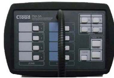
Diseño Fiable y Robusto y Calidad de Construcción