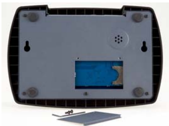
Slot para tarjeta SD extraíble (base)