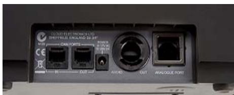
Conectores RJ45 – DCM1 o Conexión Analógica Z8 (o cualquier sistema de terceros)