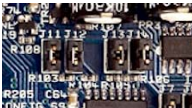
Banco de Jumpers que permiten "Apagar" zonas